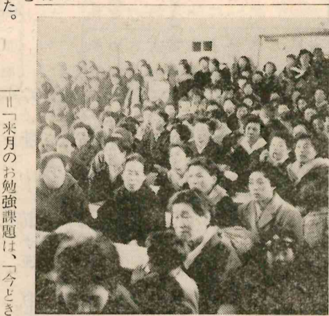
大野・熊町 両婦人会総会 終る