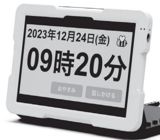
ケアビー (実証実験用タブレット)