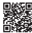
マイナポイント 事業サイト