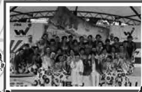
よさこい飯能乱舞 11:10~