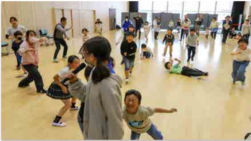
「だるまさんの一日」で鬼役に駆け寄る児童ら