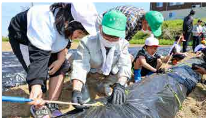
町農業委員から苗の植え方を教わる児童ら

町農業委員会は5月12日、町内大川原地区でサツマイモの苗植えを行いました。同委員会が主体となったサツマイモ栽培は今年で3年目。町職員や町農業委員ら約30人が参加し、南平の畑約20aに「紅はるか」と「シルクスweet」の2種類の苗を植え付けました。収穫したサツマイモは今秋のふるさとまつり等のイベントで活用する予定です。