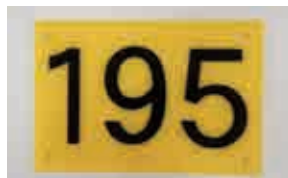
番号プレートの例

番号プレートは6月頃までにごみステーションに取り付けられます。番号プレートの付いていないごみステーションは、ごみの収集が行われなくなりますので、7月1日以降はごみを出さないようにしてください。