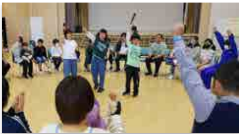
「フルーツバスケット」で遊ぶ参加者