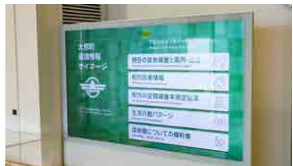
町役場のエントランスに設置しているサイネージ端末