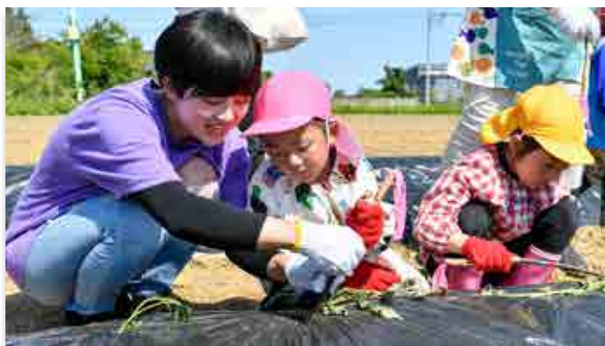
サツマイモの苗植えに挑む園児ら

町農業委員会は5月12日、町内大川原地区でサツマイモの苗植えを行いました。同委員会が主体となったサツマイモ栽培は今年で3年目。町職員や町農業委員ら約30人が参加し、南平の畑約20aに「紅はるか」と「シルクスweet」の2種類の苗を植え付けました。収穫したサツマイモは今秋のふるさとまつり等のイベントで活用する予定です。