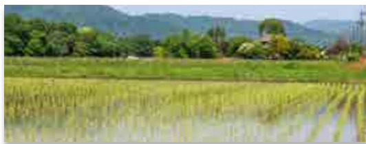
コシヒカリが植えられた実証田

これまで同区域内では、下野上清水、熊錦台、旭台で1年ずつ水稻が栽培されており、旭台での栽培は昨年に