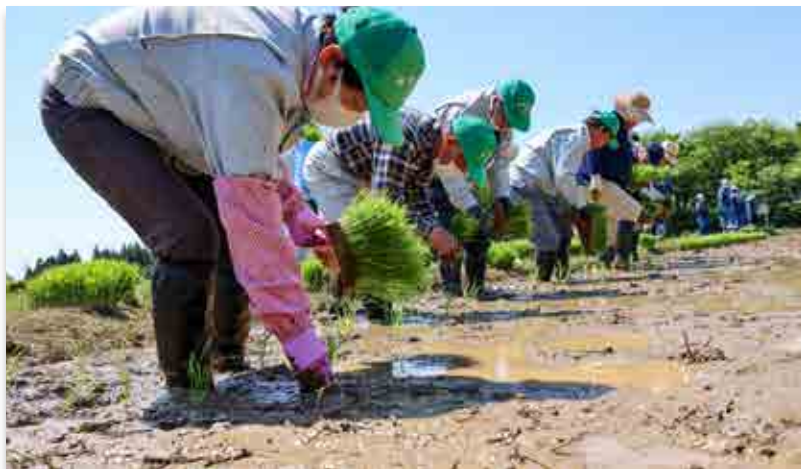
田植えを行う町農業委員ら

同区域での水稻栽培は4年目。昨年までの3年間は、放射性物質検査用のコメを採取する試験栽培が行われ、検査で放射性セシウム濃度が国の基準値を下回ったため、今年から実証栽培に移行されました。