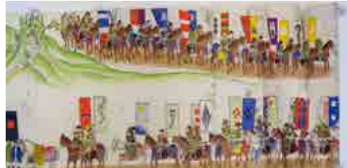
「全国之豪華大祭典行列絵巻（昭和12年）」（熊町中野家資料） 相馬野馬追の観光パンフレットのようなものと考えられます。騎馬武者行列の様子が描かれています。