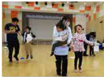
「ゴールを目指せ」に挑む出場者

町立学び舎ゆめの森の交流会が5月1日、町交流施設 linkる大熊で開かれました。