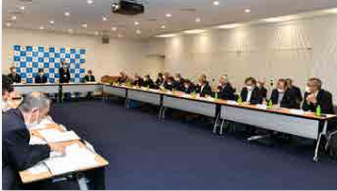
あいさつする島副町長

行政区長会が4月28日、大熊町役場で開かれました。会議では町執行部から特定復興再生拠点区域の工事の進捗状況など令和5年度重点事業が説明された後、参加した行政区長らから西工業団地に立地予定の企業に関する質問や、町の相談体制の強化に対する要望が挙げられるなど相互理解が深められました。