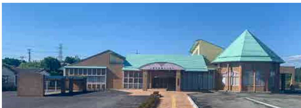
改修工事を行った町保健センター

て本来の用途で再運用するため、昨年度から改修工事を行ってきました。除染や室内のクリーニング、床の補修や照明のLED化、調理実習室の調理台や和室の畳の更新を行いました。エントランスのブロックやアスファルトも張り替え、オール電化への切り替えにも対応しました。