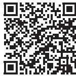
令和5年度 ごみカレンダー

なお、ごみカレンダーは広報おおくま3月1日号を 町内の住所で受け取られている方 に配布済みです。町外の住所で広報を受け取られている方で、ごみカレンダーが必要な方は、町公式サイトをご覧ください。