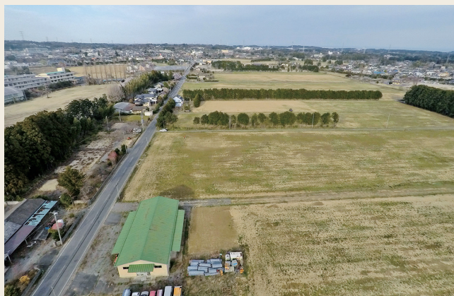
開発に期待がかかる旧梨畑エリア