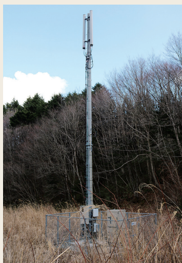
万右工門地区にある携帯電話基地局

国道288号線の安全の確保と緊急時に対応できるよう玉の湯の西地区と望洋平地区に携帯電話会社3社の基地局を整備します。