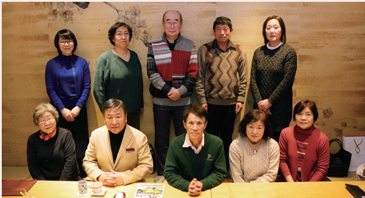
今を見つめ前向きに

大熊町からの避難者及び移住者で構成し、仙台市を拠点として東北全体の交流会を行っています。今を見つめ・前向きに・仲良く語り合う空間の共有をコミュニティの理念としています。