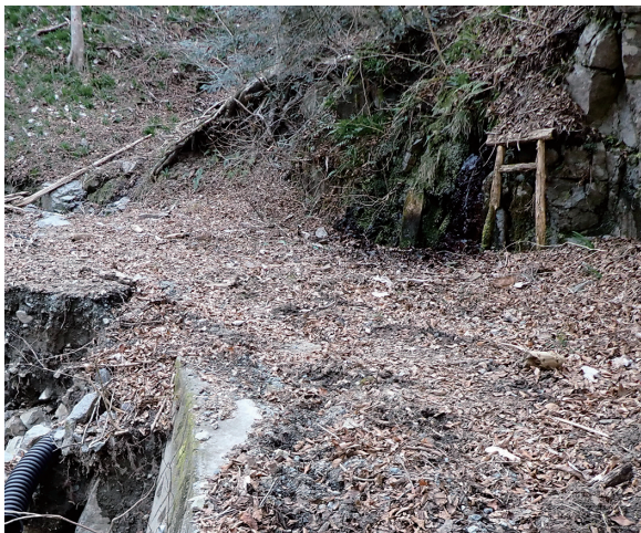
「小夜姫の涙」洗掘・崩壊も時間の問題