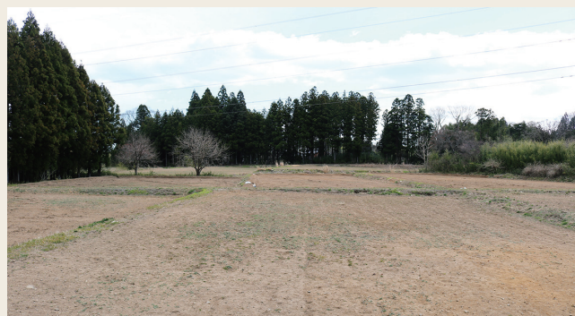
酒米を栽培する実証田

約40アールの水田に酒米に適した「五百万石」を栽培し会津若松市内の酒蔵で醸造します。