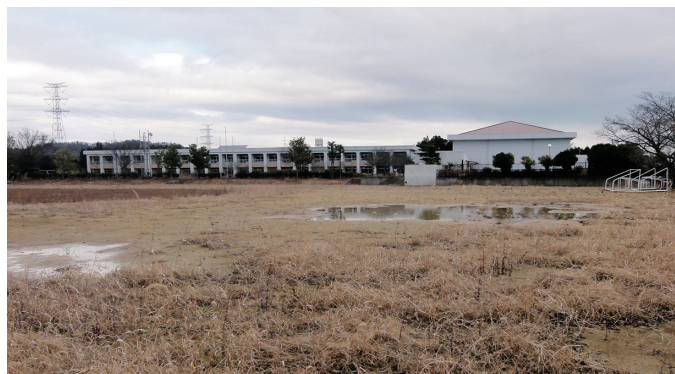
大野小学校グラウンド

阿部 立ち入り規制緩和区域内にある大野小学校グラウンドを多目的に使えるように整備すべきではないか。校舎の隣にはサブグラウンドもある。整備することによりふるさと祭り、消防団の検閲スポーツ施設として使用が可能になり駐車場も確保できる。令和4年春の特定復興再生拠点の解除に向けて帰還困難区域内を利用することにより町民の復興に対する関心が高まると思う。町長の見解を伺う。