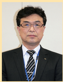
出身 会津若松市 任期 令和2年4月1日～

昨年より空席になっていた副町長の人事案が追加提出され、議長を除く11人全員の同意により選任されました。