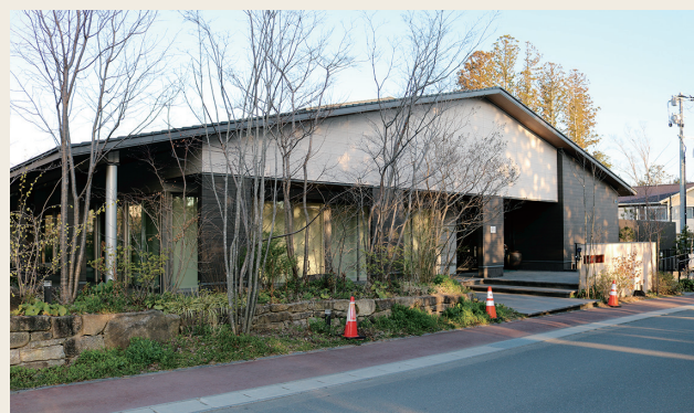
補助が増額になる大熊食堂