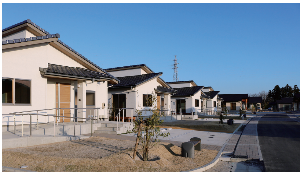
安全安心は防犯灯から

町長 現在、大川原の災害公営住宅には整備工事の際にフットライトが設置されているが住宅界隈が暗いという話をいただいている。住宅地を照らす照明は明るすぎると眩しく暗いと犯罪や怪我の恐れがあることから、警察などにアドバイスをいただきながら設置場所を検討していく。また、役場と災害公営住宅間については次年度、新たにソーラータイプの防犯灯を設置する予定だ。大野駅については東西口の広場にソーラータイプの照明を計19基設置しており、夜間の乗降客も安心して駅を利用できるよう対策を取っている。立入規制緩和については見回り隊にパトロールの際に防犯灯が切れないか確認をしてもらい、故障等があれば修繕・交換等対応していく。犯罪抑止の観点から設置の必要がある場所については、順次防犯灯を設置していく。本体が故障している防犯灯は、平成29年度