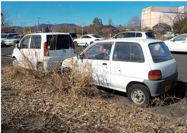
放置されたままの車両

ている場所により、優先順位をつける必要があると思うので、国に対し、優先順位を付け撤去するよう要請していく。