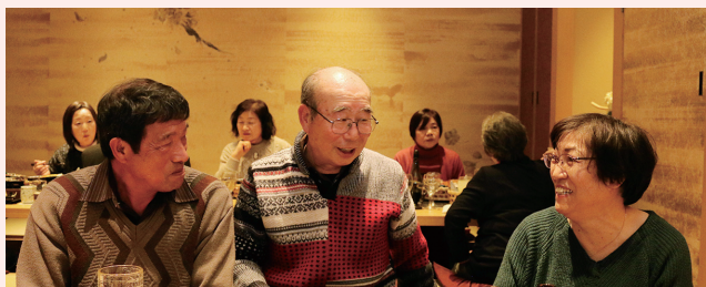
仲良く語り合う会員