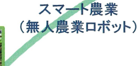
スマート農業（無人農業ロボット）