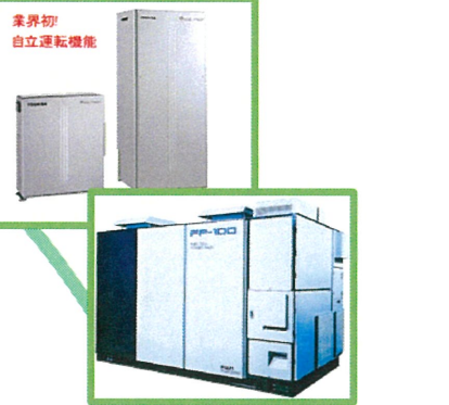
自立・分散型水素エネルギー（燃料電池）

復興シンボルの拠点形成、福島イノベーション・コースト構想の進化による多角産業地域を形成、中山間地域の魅力づくり