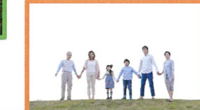
福祉・医療・介護