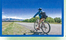
サイクリングロード