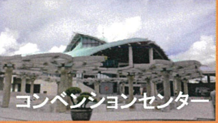
コンベンションセンター