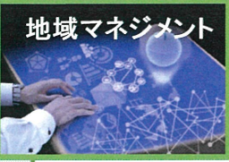
地域マネジメント