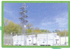
地域エネルギー管理システム