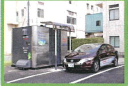
水素ステーション