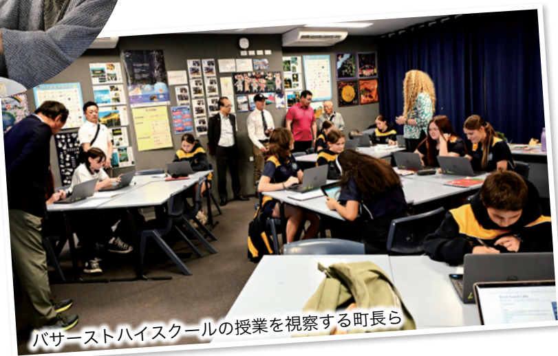
バサーストハイスクールの授業を視察する町長ら