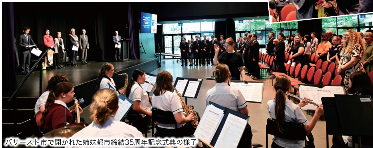
バサースト市で開かれた姉妹都市締結35周年記念式典の様子

バサースト市との姉妹都市協定は、1991年3月25日に結ばれました。2021年3月の協定締結30年の際は、新型コロナウイルスの世界的流行で互いの渡航が叶わず、オンラインでの式典開催になりました。