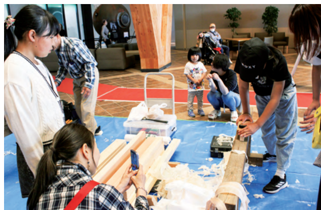
カンナがけ体験する参加者ら

商業体験のほか会場にはたい焼き・クレープのキッチンカーもあり、イベントには大熊町民をはじめ、ゴールデンウィークに帰省された方や近隣地域の方など、400人を超える来場者でにぎわいました。