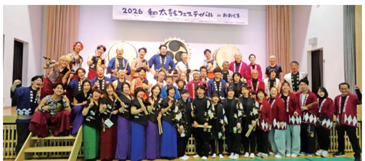
集合写真に納まる和太鼓奏者ら