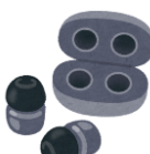
ワイヤレスイヤホン