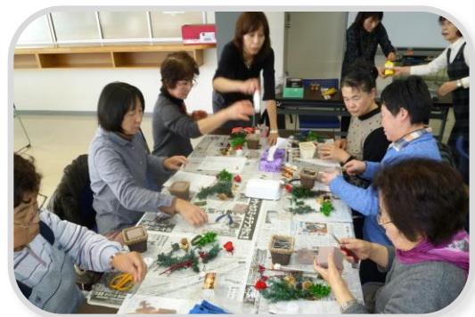
上手にできた！どこに飾ろうかな？

今回、多数の参加申し込みありがとうございました。今後も多数の参加をお待ちしております。