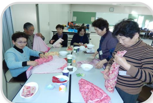
他町村の方とラッピングに挑戦中！！

毎月第1・3水曜日、郡山市に避難されている方を対象に郡山市総合福祉センター内にてサロンを開催しています。