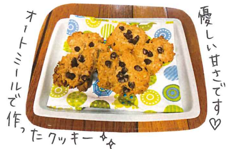
オートミールで作ったクッキー

奥さんが手作りのお菓子を振る舞ってくれました♡ 「ここにはお菓子屋さんもないじゃない？だから最近作るようになったの」とのこと 「ないなら自分で作る」精神がすばらしい