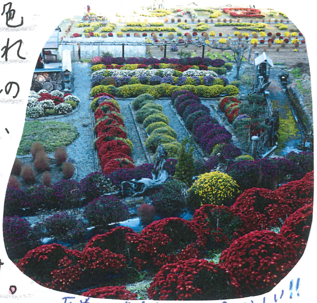
左巻の右吉邸一。すばらしい!!

こんにちは！11月、町は色とりどりのまん丸で彩られました。今号が皆さんのお手元に届く頃には、見頃が終わっているのは残念ですが、もはやざる菊の名所と言えそうな秋の大川原です。