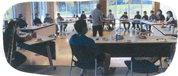
役場1階の多目的スペースです